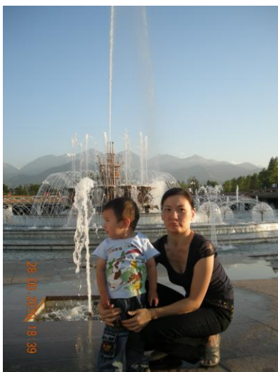
Родилась я в Джамбульской

области, папа работал буровиком, мама в банковской системе. Детство прошло в прекрасном городе Алматы, но, как у любого ребенка, имеющего физические нарушения, у меня были сложности в общении со сверстниками (непонимание, незнание, жестокость и т.д.).